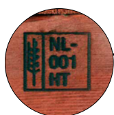
A marca na paleta com tratamento HT